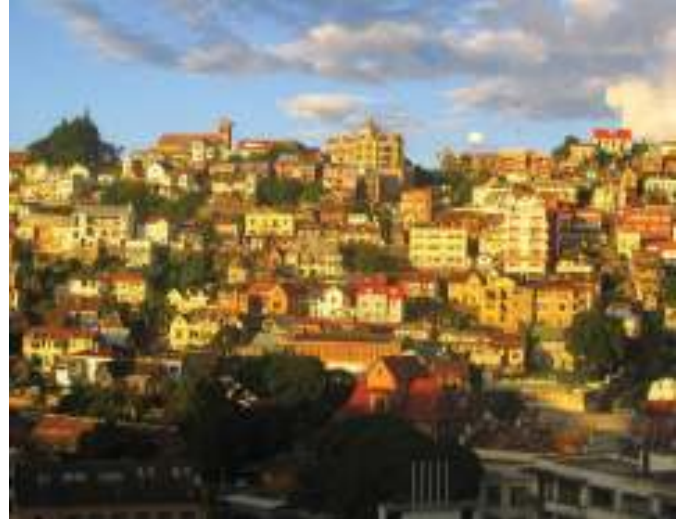
Vue de la capitale Antananarivo