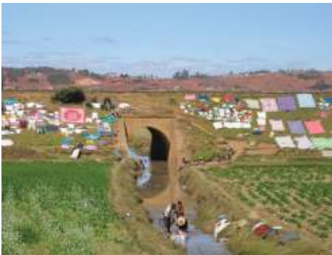
Séchage du linge

11. Les malgaches sont les premiers consommateurs de riz par habitant au monde.