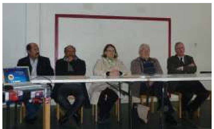
Photo de l'Assemblée Générale

Artitlon : Art malgache sous toutes ses formes et participation d'artistes peintres, à la Galerie 3F, 58 rue des Trois Frères Paris 18 ème .