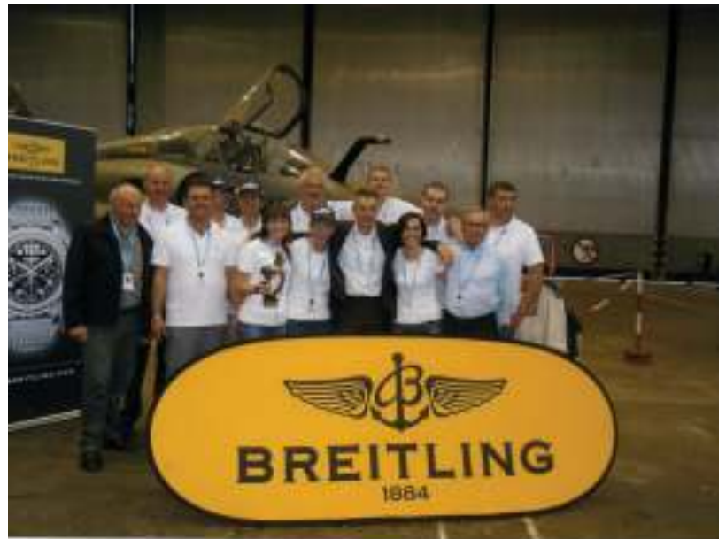
L'ÉQUIPE PHILEAS 124 2EME ANNÉE DE PARTICIPATION

Le 28 juin, à l'issue de la compétition, la remise des prix aura lieu sur la base aérienne de Villacoublay.